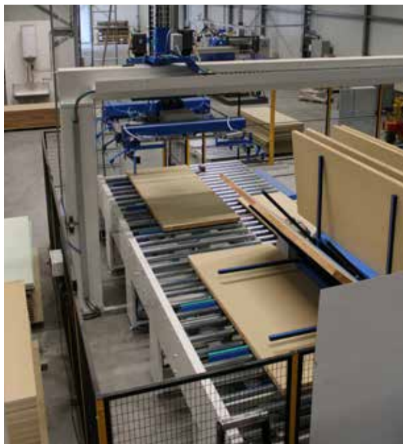
Kegro startte in september 2021 met een nieuwe productielijn voor vlakke deuren.

Nadere informatie: Kegro Hal 6, standnummer 6523